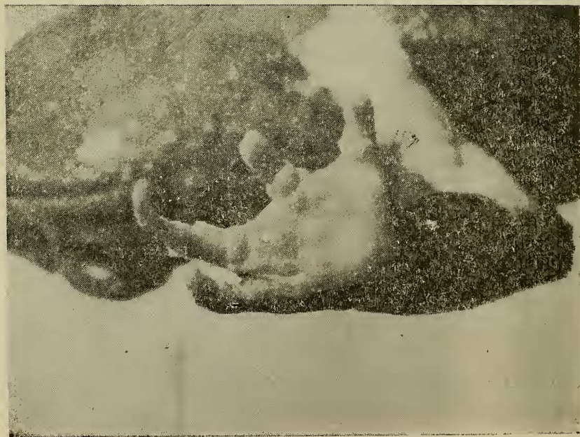
Figura N.º 4 — Vista da palma da mão do Holótipo